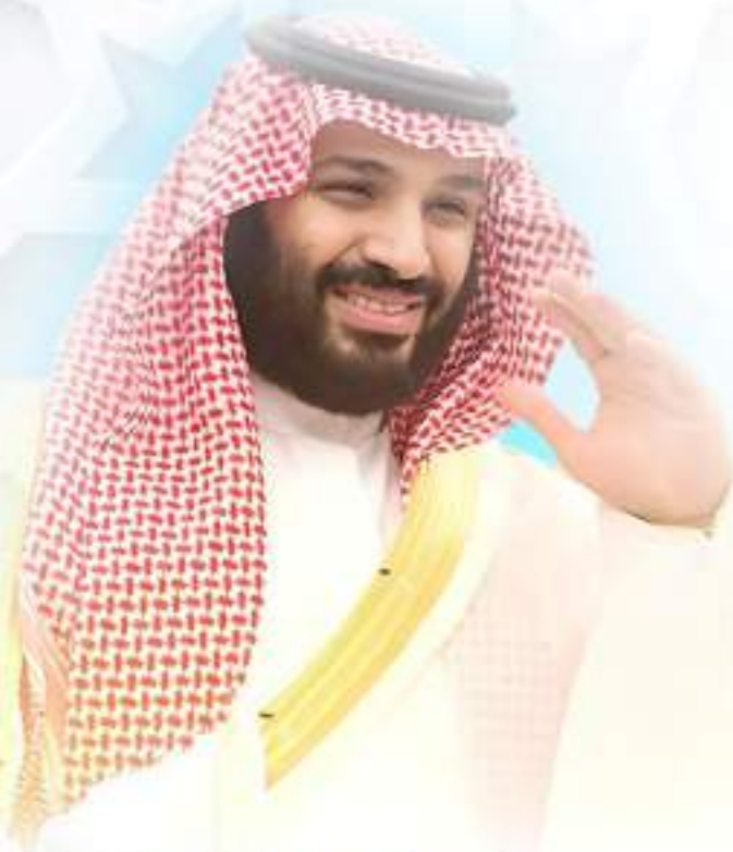
صاحب السمو الملكي